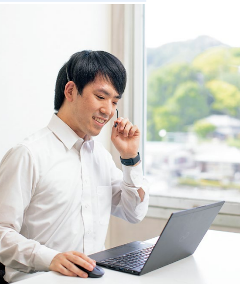
顧客とのオンラインでの打合せ風景。コミュニケーションを通じて、要望を正確に把握

することで、社員のワークライフバランスを向上させている。さらに、売上や利益の実績から点数化される人事評価制度により、その人のがんばりがきちんと給与に反映されるという。健康経営にも取り組んでおり、健康経営優良法人（中小規模法人部門）に7年連続で認定されている。今年中の株式市場に向け、ますます信頼される企業を目指す同社に注目したい。